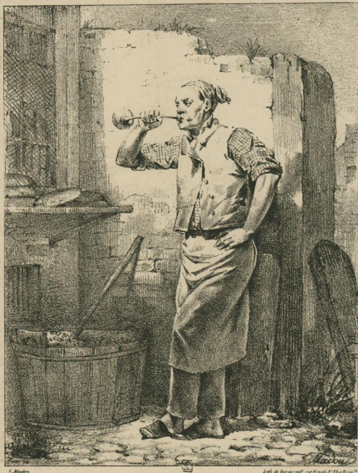
BOULANGER CORNANT AU PAIN CHAUD. D'après la lithographie de Madou.